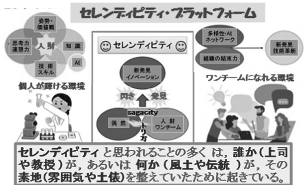
図4 セレンディピティ創出のためのプラットフォーム

若い人には、「セレンディピティ感度」(気付きの検出能)を高めながら、「やってくる偶然」だけではなく「迎えに行く偶然」にも遭遇してほしい。その時、多様性としての生成系AIとのテンペアは、アハー体験への装置となるに違いない。